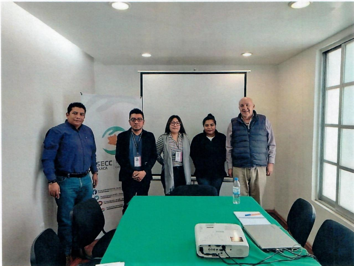
Ilustración 2.1. Reunión de trabajo con personas servidoras públicas de la SESECC y el Municipio de Santiago Pinotepa Nacional, Región Costa.