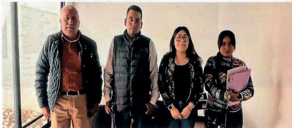
Ilustración 1. Reunión de trabajo con personas servidoras públicas de la SESECC y el Municipio de Santiago Huaucuililla. Nochixtlán, Oaxaca.

El 24 de enero del año 2024, el Municipio de Santiago Huaucuililla, Nochixtlán, Oaxaca, acudió a las oficinas de la Secretaría Ejecutiva del Sistema Estatal de Combate a la Corrupción, a efecto de pedir orientación y apoyo respecto al Órgano Interno de Control, que debe contar dicho Municipio, de conformidad con lo previsto en el artículo 126 TER de la Ley Orgánica Municipal, en dicha reunión con el Municipio se les explicó que atendiendo al número de habitantes con que cuenta su Municipio, deberán contar con la Comisión de Rendición de Cuentas, Transparencia y Acceso a la Información, se les explicó de la importancia de las funciones de dicha Comisión así como las funciones de la misma, se les recomendó crear a la brevedad posible la misma y solicitar una reunión de trabajo en el momento en que ellos determinen, a efecto de explicarles el sistema electrónico de captura de declaraciones patrimoniales y de Intereses, para que las personas servidoras públicas de dicho Municipio, estén en condiciones de dar cumplimiento a lo establecido en la Ley de Responsabilidades Administrativas del Estado y Municipios de Oaxaca.