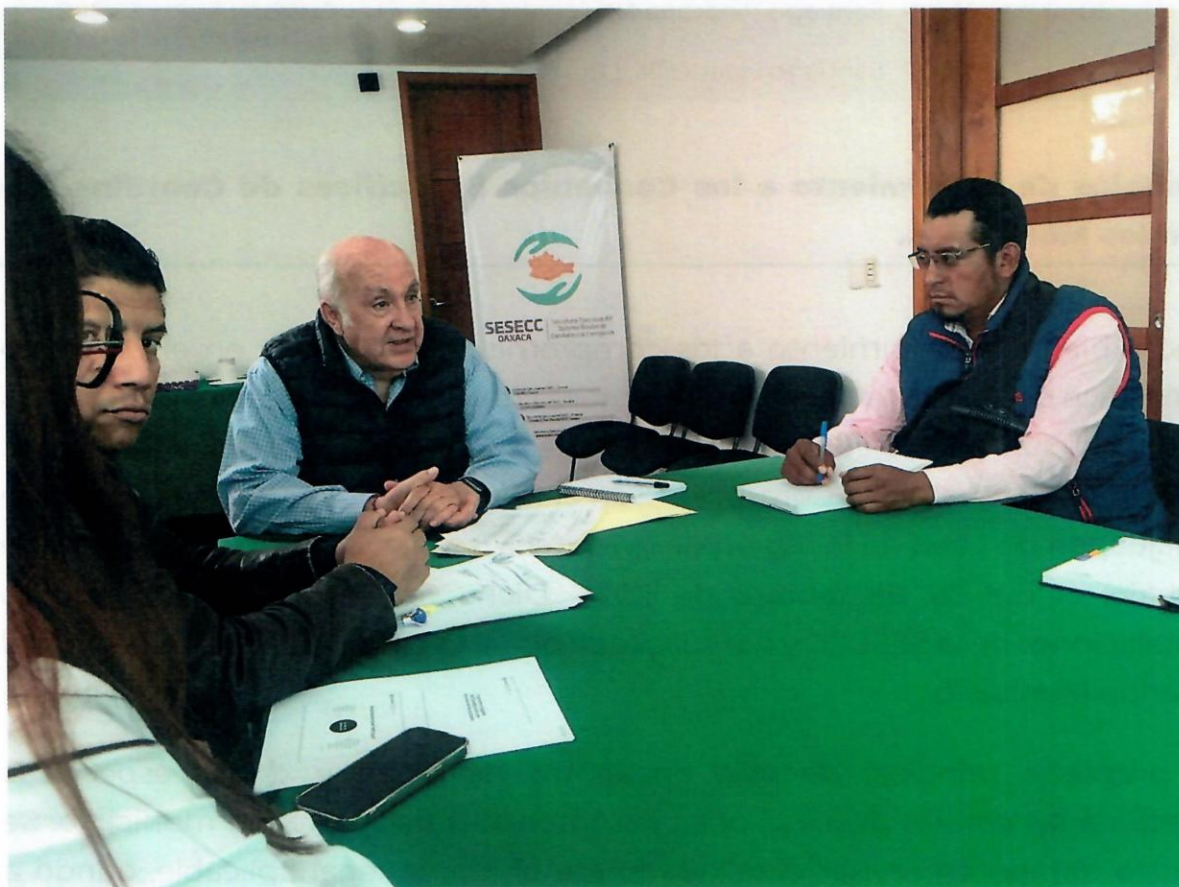
Ilustración 3.1. Reunión de trabajo con personas servidoras públicas de la SESECC y el Municipio de Santiago Huaucilla, Mixteca.